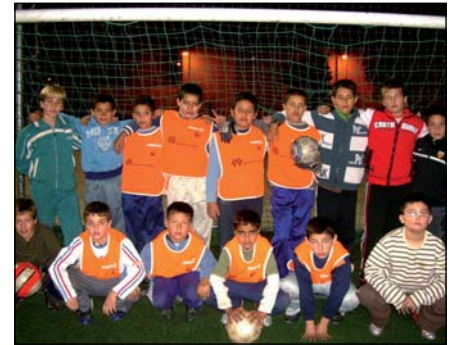
Equipo de niños de Baladre de otros años