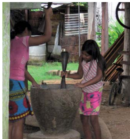
Pilado de arroz de forma manual.