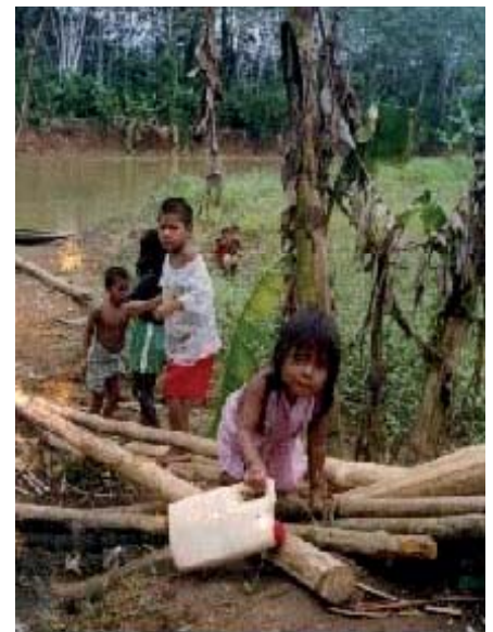
Arriba, viviendas en la zona de Darién. A la izquierda transporte en piragua por el río Tupiza y, sobre estas líneas, unos niños junto al citado río que pasa por varios poblados de Darién.