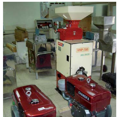
Piladora de arroz que se va adquirir.

En esta ocasión, como estaba anunciado, los beneficios del concierto, tres mil setenta y nueve euros, van a destinarse a la compra de una piladora de arroz con la que los habitantes de Bayamón, de la deprimida zona de Darién (Panamá) puedan dejar de realizar esta tarea a mano, en la que hasta ahora colaboran no sólo los adultos, sino también los niños.