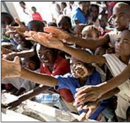
Piden alimentos desesperadamente